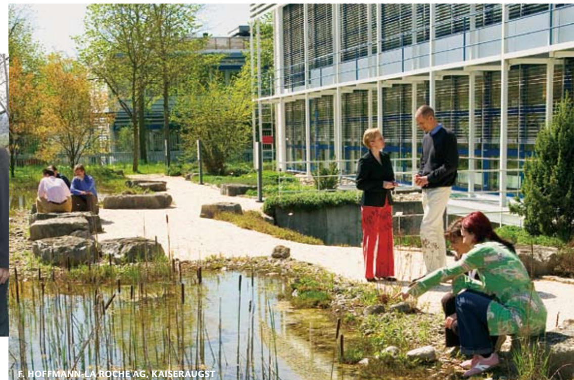
F. HOFFMANN-LA ROCHE AG, KAISERAUGST