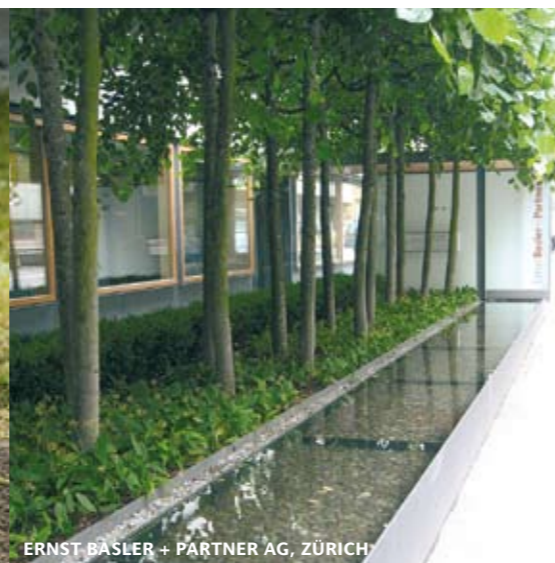
ERNST BASLER + PARTNER AG, ZÜRICH