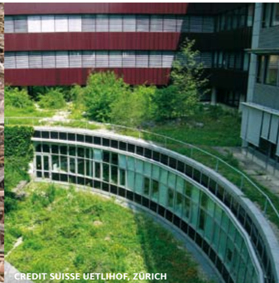
CREDIT SUISSE UETLIHOF, ZÜRICH