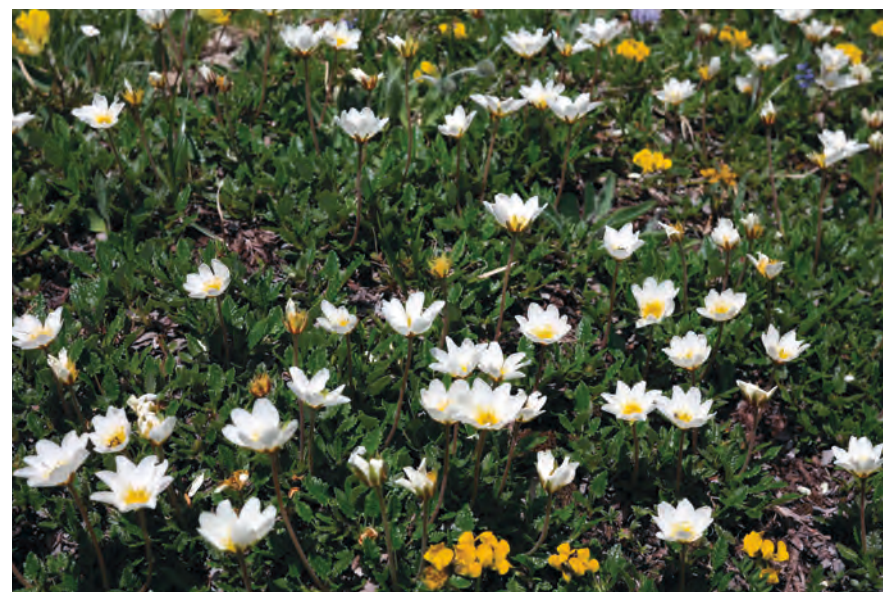
La Dryade à huit pétales qui fleurit d'avril à mai, se plaît autant dans les platebandes que sur les balcons. Elle se contente de peu d'eau et d'un substrat maigre.

Photo du haut: Les papillons, abeilles sauvages et hérissons que l'on peut observer à l'intérieur des plates-bandes de vivaces, montrent que celles-ci ont une forte valeur écologique, bien plus élevée que celle des surfaces plantées de végétaux horticoles ou exotiques.