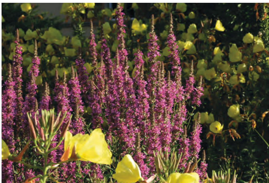
La Salicaire commune et l'Onagre bisannuelle à floraison jaune, apportent un peu de couleurs, notamment dans les emplacements maigres et secs.

Les vivaces sont des plantes pluriannuelles. En plus de proposer un spectacle diversifié et multicolore, elles offrent abri et subsistance à de nombreux animaux. En fonction des saisons, on peut y observer l'activité des abeilles, la nidification des oiseaux ou la petite faune qui y trouve refuge.