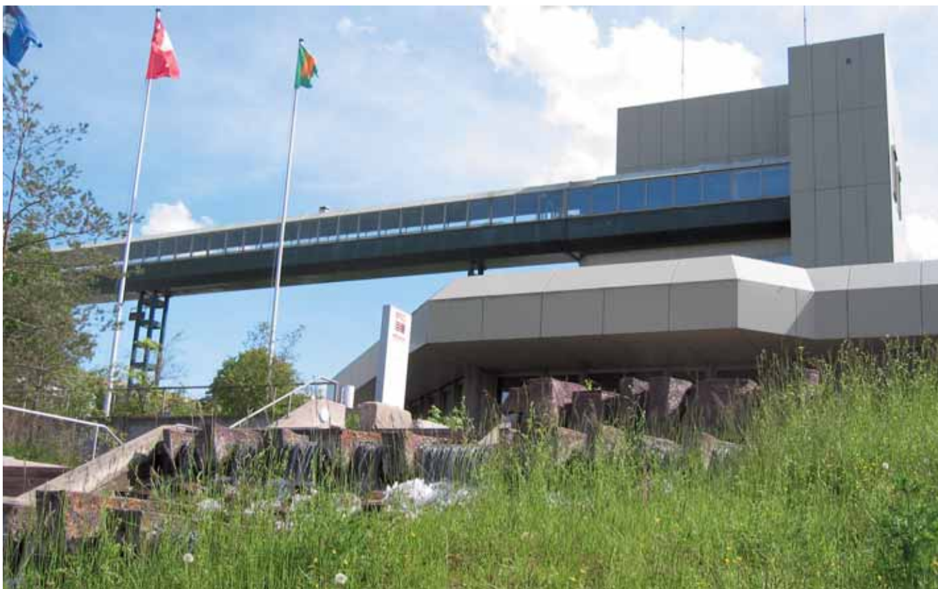
Auch neben intensiv benutzten Umschlagplätzen findet sich viel Raum für die Natur, zum Beispiel bei der Migros-Verteilzentrale Suhr AG.

Qualitätslabel «Naturpark der Wirtschaft» ausgezeichnet. Bislang wurde das Zertifikat an fast 250 Firmensitze vergeben. Die «Naturparks» sind zwischen 220 Quadratmeter und zwei Quadratkilometer gross, liegen in der ganzen Schweiz verteilt, meist mitten im Siedlungsgebiet, und decken die ganze Branchenvielfalt ab. Die Firmenareale haben verschiedene Aussehen und Charaktere, aber alle erfüllen die Kriterien für das «Naturpark»-Label: