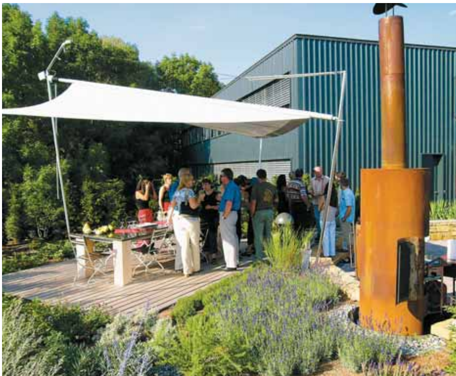
Gesellige Grillabende stärken den Teamgeist – ein zur Nutzung einladendes Firmenareal wie hier bei der Contec AG in Uetendorf BE ist die Voraussetzung dafür.

das häufige Schneiden bedingt einen grossen Arbeitsaufwand. Eine Blumenwiese ist auch grün – je nach Jahreszeit sogar bunt. Zudem weist sie eine grosse Artenvielfalt an Kräutern und Gräsern auf und bietet Insekten und Kleintieren Nahrung und Versteckmöglichkeiten. Und da bloss